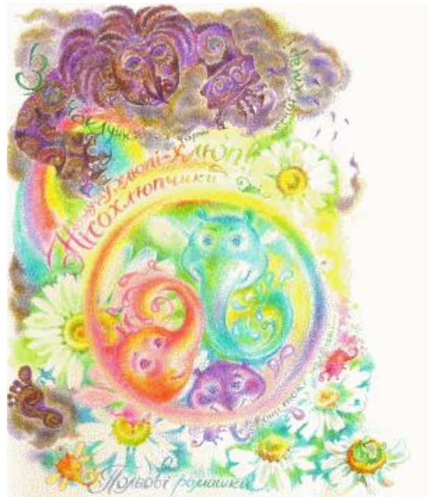
мал. О. Турської

І от одного разу над квітковим полем, саме в той момент, коли Нісохлюпчики хлюпотіли мелодію, а Веселка сяяла, пролітала зла Чаклунка на чорній-чорній хмарі й вкрала Ввеселку. Так, так, вкрала й сховала в скриню, яка була на її чорній хмарі. Сховала в скриню й сіла на неї.